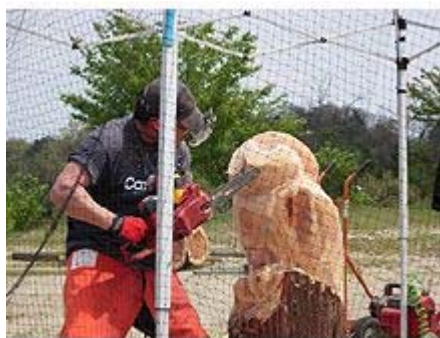
公園「可児市役所北側」に、チェンソーカービング