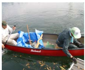
▲ ダム湖クリーン作戦の様子

第三十回全国豊かな海づくり大会「ぎふ長良川大会」のサテライト会場として川辺町は「ボートの町からの贈り物 川から海へ」というテーマで平成二十二年六月十二日から六月十三日の二日間行事を行います。それは飛騨川ダム