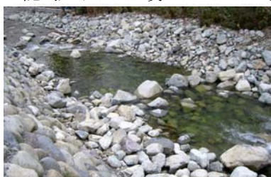
▲河川での施工状況

お店は完全予約制との事なので、予め予約をお願いします。「茶懐石 やまし」下呂市小坂町大洞2569番地2 TEL 0576(62)3474 定休日(不定休) by 柘植 ユエ5 2つの種 下呂土木事務所にて施工されたとても環境に配慮された河川の工法をご紹介します。ジョイントロックというこの方法は、現地にある自然石を利用し、ロックアンカーとワイヤーロープで連結する、とても環境に優しい工法です。岐阜県の自然共生工法にも認定されています。河川の線形変更や、護岸・魚道での利用、流速調整と幅広く採用できる工法です。 特長はさまざまありますが、現況の河床に近い材料構