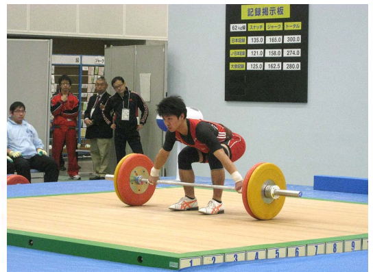
「おいでませ！山口国体ウエイトリフティング競技リハーサル大会」の様子

し、着々と大会開催に向けた準備が進められています。ぎふ清流国体開催までいよいよ1年半となった今年度は、大会運営方法や進行等の検証を行う意味を含め、次の日程で競技別リハーサル大会が開催されます。