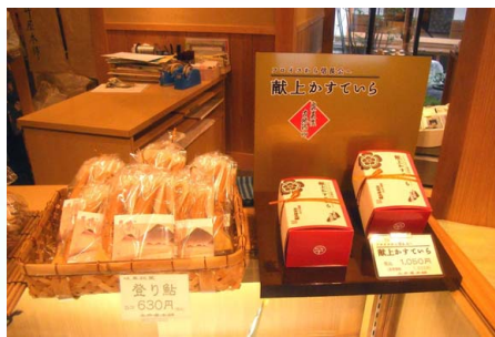
「登り鮎」と「献上かすていら」

玉井屋本舗は岐阜銘菓「登り鮎」で名高い和菓子のお店で、ホテル十八楼の真向かいにあります。取材中もお客様が絶え間ない状態でした。おすすめの銘菓をたずねますと、たくさんある中から「登り鮎」、そしてもうひとつ岐