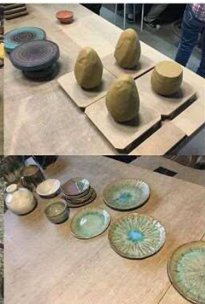
気持ちええな〜ホカホカ