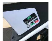
バッテリー 収納スペース