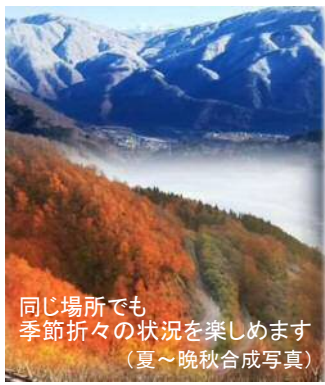
同じ場所でも 季節折々の状況を楽しめます （夏〜晩秋合成写真）

今回は、「白山白川郷ホワイ トロード」の秋をご紹介します。 この道は岐阜県白川村と 石川県白山市を結ぶ全長33・ 3kmの山岳道路で、以前は「白 山スーパード」と呼ばれて いました。最も高い位置にあ る三方岩駐車場（標高145 0m）では、9月下旬から紅 葉を楽しむことができます。 また、昼夜の寒暖差が大きい 秋晴れの早朝（午前9時頃ま で）には白川郷を包み込む雲 海をお楽しみいただけるよ う、岐阜県側料金所では通常 より開門時間を1時間早める モーニングタイム（午前7時 〜午後5時）を実施していま す。紅葉情報等はホームページ （ https://hswhiteroad.jp ）