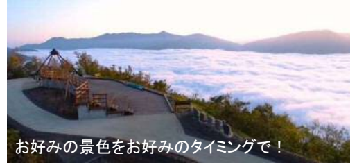
お好みの景色をお好みのタイミングで！

p/）で確 認すること ができます ので、この 機会にぜひ 雲海×紅葉 の絶景が楽 しめるホワ イトロード に行ってみ ませんか？ by島崎